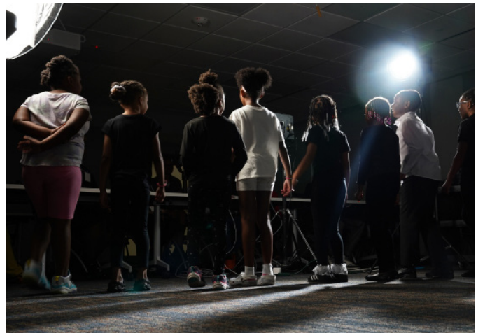
젊은이들은 Upcoming Storytellers 캠프에서 영상 제작에 대해 배웠습니다.