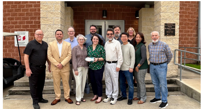
MES 팀은 텍사스 킹스빌에 있는 장로교 팬 아메리칸 학교 (PPAS)의 리더들을 만났습니다. PPAS는 크리스마스 기쁨 헌금의 수혜자 중 하나입니다.