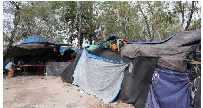
2월에 MES 팀은 텍사스 남부로 여행을 떠났습니다. 이들은 하루 동안 국경을 넘어 멕시코의 마타모로스에서 이민자 현장을 방문했습니다.